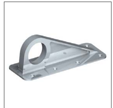
Abbildung 2: Konventionelles Bracket