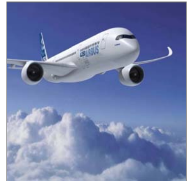
Abbildung 1: AIRBUS A350

Die Machbarkeitsstudie ergab, dass massive Gewichtseinsparungen durch den Einsatz lasergenerierter, bionischer Titanstrukturen möglich sind. Bei konsequenter Umsetzung, der in der Studie aufgezeigten Optionen zur bionische Optimierung von Brackets, können bis zu 1000 kg Gewicht in der Kabine des A350 eingespart werden. Zusätzlich konnte im Businessplan die wirtschaftliche Überlegenheit der lasergenerativen Fertigungstechnologie und bionischer Titan-komponenten nachgewiesen werden.