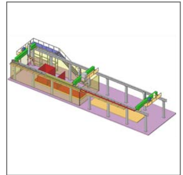
Abbildung 1: Portalanlage zur Fertigung 3-Dimensionaler Schiffstrukturen

Das Ziel des Forschungsprojektes "QuInLas" ist es, für die neuen lasergestützten Fügeverfahren wie dem Laser-Remote- und Laser-Hybrid-Schweißen Prozesse, Systeme und Bewertungskriterien zu entwickeln, mit denen sich zukünftige Anforderungen an Schweißkonstruktionen im Schiffbau erfüllen lassen. Neben der Nutzung geringer Blechdicken und dem geringen thermischen Verzug der Laserverfahren für innovative Schiffskonstruktionen soll eine Systemtechnik für das 3D flexible Laser-Remote- und Laser-Hybrid-Schweißen mit hohem Automatisierungsgrad entwickelt werden und durch integrierte Qualitätsdiagnosesysteme der QS-Aufwand deutlich reduziert werden.