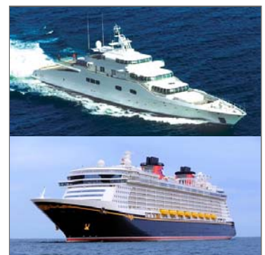
Abbildung 3: Mega Yacht und Kreuzfahrtschiff der Firmen Blohm & Voss und Meyer Werft