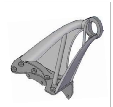
Abbildung 3: Gewichtsoptimiertes Bauteil für die lasergenerative Fertigung